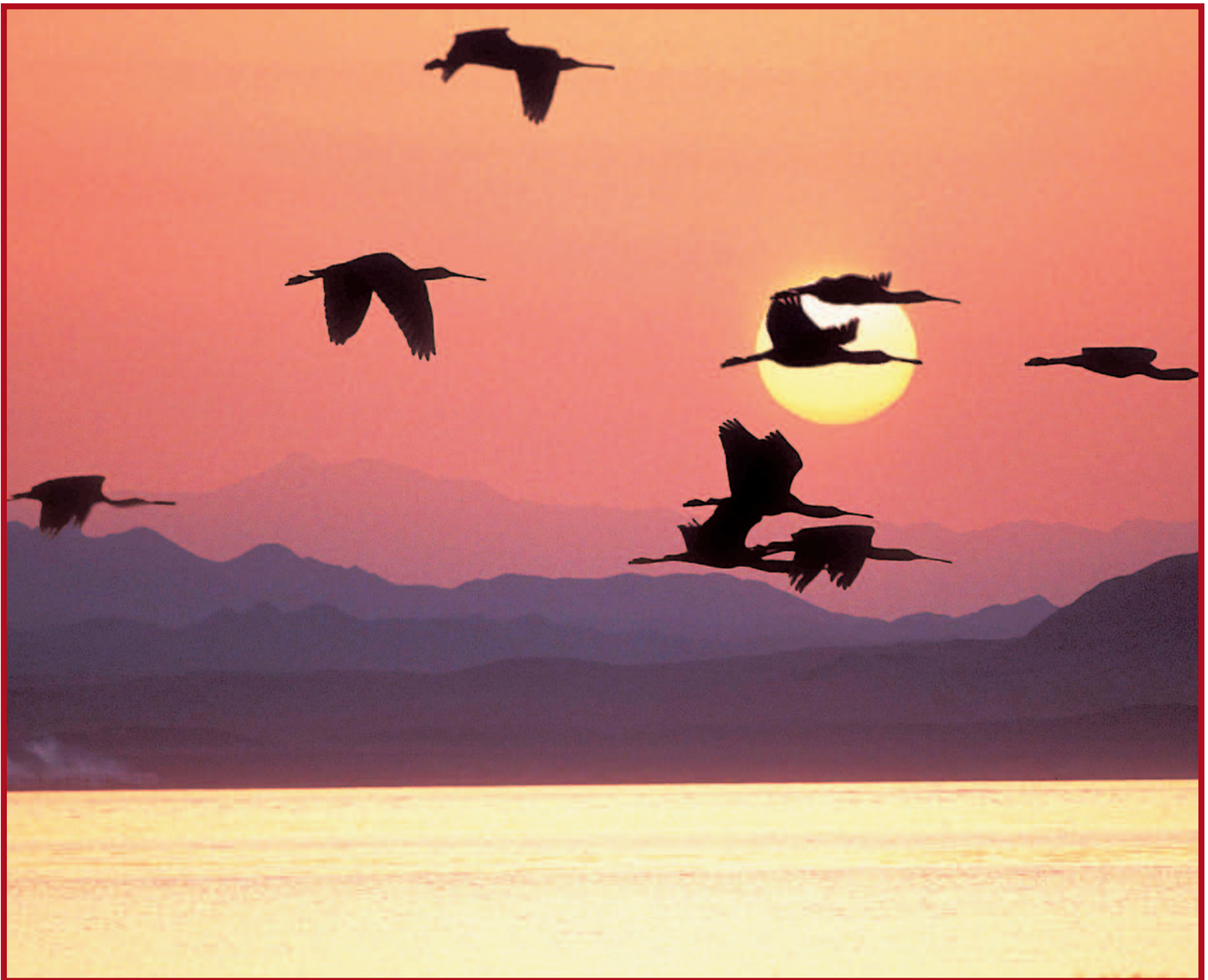
La suggestione di un tramonto da vivere in mezzo al mare, sulla barca, per poi magari immergersi il giorno dopo alle prime luci dell'alba.

qualità di cabine e servizi sono tali da consentire un vero relax.